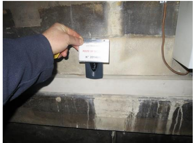
Image 1 et 2 : Ouverture de la porte de la terrasse vers l'extérieur avec la carte d'accès

Regrouper l'ensemble des personnes sur la terrasse et cheminer vers la coupole (images 3 et 4) en mettant le garde les visiteurs des irrégularités du sol.